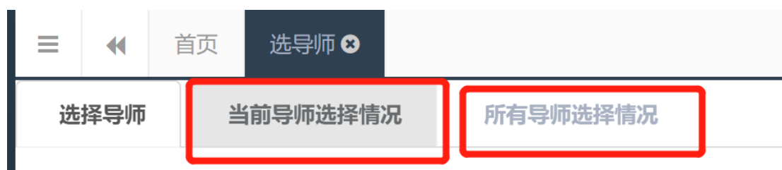
图 7 查看结果