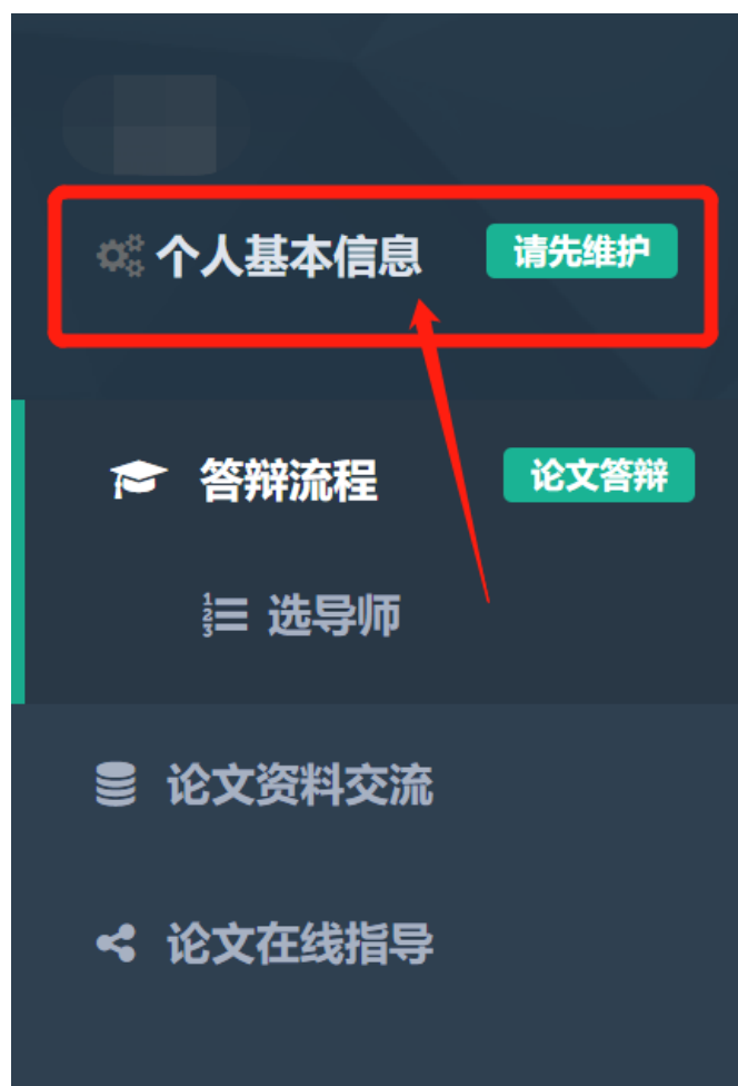
图 2：登陆后，先维护个人信息

备注：由于学院导师希望能看到学生的一些个人信息，所以通过维护您的个人信息，您选择志愿的导师 将会看到 这部分信息，作为选学生的考虑依据之一。