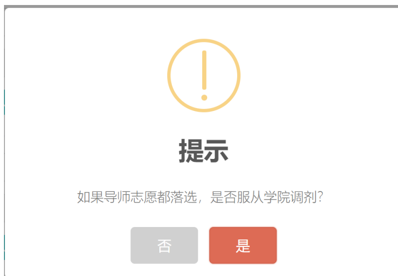
图 6 提交后的“提示”